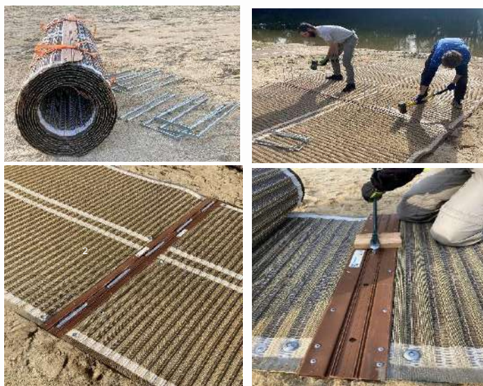
Tutti gli ancoraggi sono forniti con il tappetino. A seconda del numero di occhielli e ancoraggi sarà diverso